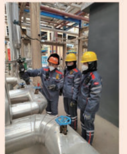
石化公司加氢车间 邢卫军

高老师对待工作一丝不苟，对待同事平易近人，没有豪言壮语，也没有惊人创举，平凡的他正在用认真的态度在化工操作岗位上绽放光彩。他也在用他的行动感染着身边人，众人拾柴火焰高，只有班组凝聚力提升，团结协作，才能提高工作效率，确保装置的安全运行。新的一年让我们一起重新起航奔向辉煌的明天。